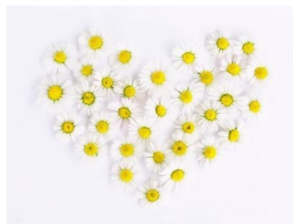
Ganglmayr Anna (85) Graben 6/1 (ohne Foto)