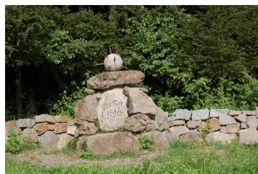
Denkmal in der Ledererwiese

Infos zu diesen Veranstaltungen folgen jeweils in der Stadtinfo.